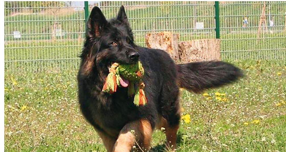
„Die Erziehung soll Hund und Mensch Spaß machen. Das Lieblingsspielzeug ist eine tolle Belohnung!“

Bei der Erziehung Ihres Hundes können Ihnen kompetente Trainerinnen/Trainer behilflich sein. Woran Sie diese erkennen, lesen Sie auf den folgenden Seiten.