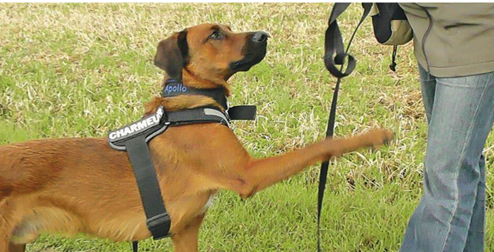
„Achten Sie darauf, dass sich Ihr Hund auch mit den Trainer/innen wohl fühlt. Sie sollten stets beide respektvoll behandelt werden.“