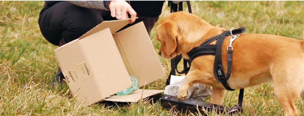
„Hunde werden liebevoll an neue Reize herangeführt und ihre Neugier geduldig in gewünschte Bahnen gelenkt.“

Nachhaltige, moderne Hundeerziehung basiert deshalb auf Motivation, Freude und liebevoller Unterstützung. Diese Broschüre soll Ihnen dabei helfen, die richtige Wahl für sich und Ihren Hund zu treffen.