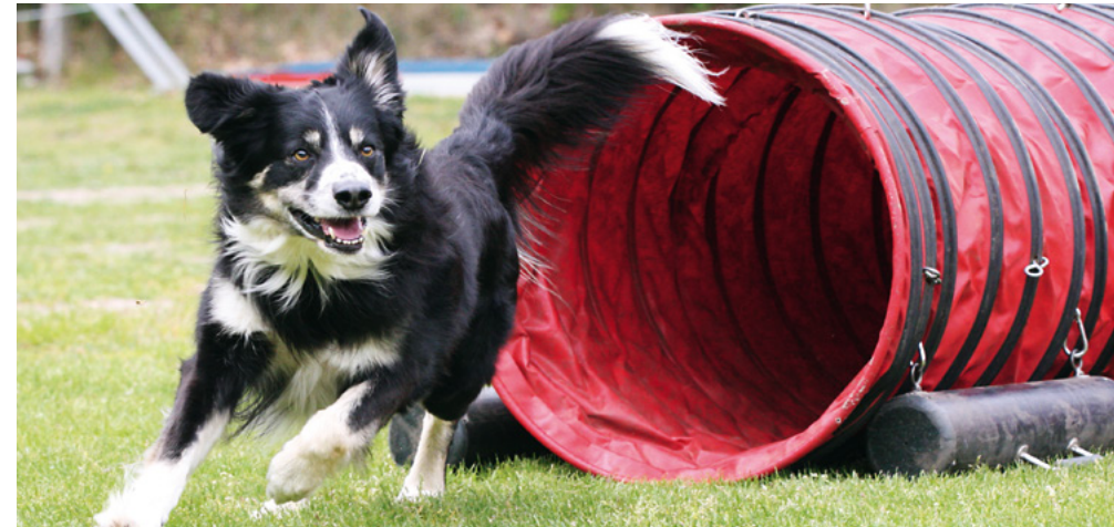
„Sicherheit geht vor! An vorhandenen Geräten sollte nur unter Beaufsichtigung der Trainer/innen gearbeitet werden.“